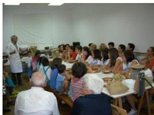
Hacer pan fue toda una experiencia para mayores y chicos