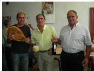
Los ganadores de la Tuta 2007