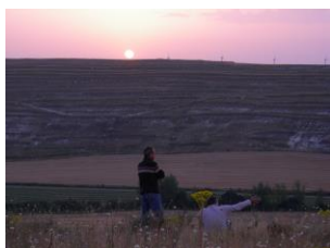
Amanecer, el día de acampada