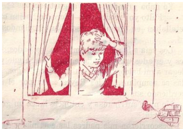
La caza del gorrión

Su alimentación es muy variada y diferente según el hábitat ocupado. En zonas cultivadas las semillas y granos de cereales constituyen probablemente el 60-80 por 100 del total. En pueblos y ciudades comen más insectos de lo que parece y restos que hay en calles y plazas, muchos vegetales, pan, etcétera. Se ven a menudo gorriones con escolopendras y ciempiés que capturan entre la madera y las vigas de tejados y desvanes. La fruta no es despreciada y tampoco larvas, lombrices de tierra y arañas.