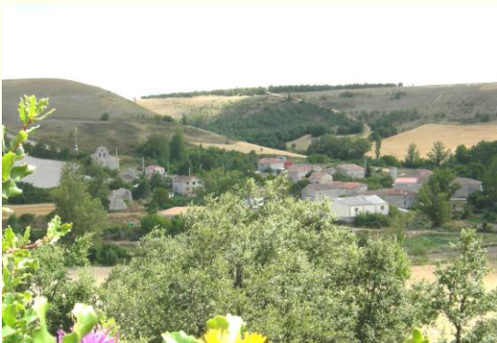
Vista general de Hormazuela