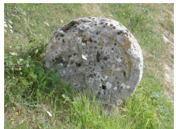
Cruz labrada, sobre piedra en las cercanías de la iglesia

Por lo leído en el diccionario de Pascual Madoz, Hormazuela en cuanto a edificios no ha crecido mucho. Madoz dice lo siguiente: situado en un pequeño valle formado por dos cuevas al este y Oeste. Tiene 18 casas, 45 almas, una fuente en el pueblo y siete en el término. El clima es frío y las enfermedades más corrientes son las constipaciones y las irritaciones gástricas....?. dice que los caminos son buenos y el correo les llega a través de Villadiego. Agricultura, ganado lanar y vacuno es su industria, junto con el molino harinero. Perdices, codornices, cangrejos y truchas su caza y pesca por el 1845. A modo de curiosidad su producción anual ascendía en ese año a 281720 reales brutos, pagaron impuestos por valor de 27231 reales y una contribución de 2204 reales.