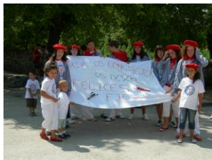
Los jóvenes rememorando la Peña.