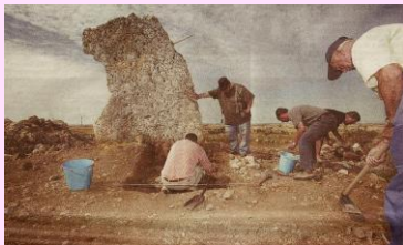
Excavaciones del pasado año 2007