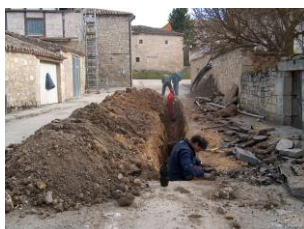
Reparando una avería de agua en invierno