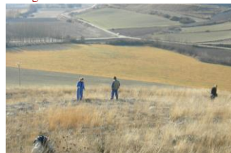
Replantado en morro S. Juan Dic. 2007