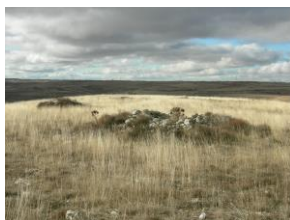
Campos secos en Diciembre