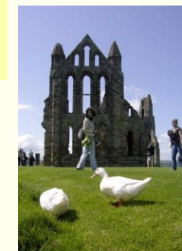
En Whitby abbey

Me disponía a cumplir uno de mis sueños. Desde pequeña siempre había querido irme de Erasmus y al estar ya en segundo de carrera tomé la decisión de que, si todo iba bien, el tercer curso lo pasaría en Inglaterra. No tenía muy claro qué sitio elegir y finalmente York fue la ciudad que me asignaron entre algunas de las que yo había elegido. A partir de ese momento lo único que tenía que hacer era formalizar la beca, ponerme en contacto con la universidad de allí y rellenar el papel más importante: el Learning Agreement . Este documento es el que permite que una vez cursadas allí las asignaturas, la universidad de origen (en mi caso la Universidad Autónoma de Madrid) pueda realizar las convalidaciones oportunas. Y a partir de ahí tocaba esperar a que la University of York me asignara residencia y me fuera informando poco a poco de todos los documentos y trámites que necesitaba hacer antes de irme.