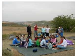
Acampada en Valdemaña