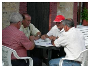
También en la fiesta da tiempo a la partida de dominó.