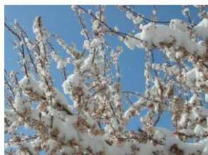
Nevada en Semana Santa

De nuevo la paciencia de Jesús, nos permite seguir las precipitaciones de todo el año 2007. Un año casi normal excepto por las pocas lluvias de los meses de Noviembre y Diciembre.