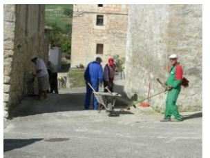
Limpiando las calles (grupo II)