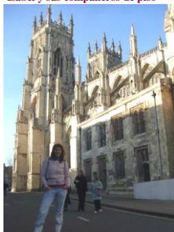
En la catedral de Minster