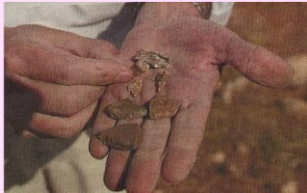
Objetos hallados en las excavaciones

Fue noticia en el Diario de Burgos el año pasado y pocos de nosotros habíamos oído hablar de este menhir, con cierta forma de oso. Quizás tampoco nuestros mayores le dieron mucha importancia. La realidad es que puede tener 5000 años y forma parte de un conjunto de menhires que marcaba la ruta a los pastores trashumantes. Ésta es al menos la tesis de los investigadores de la Universidad de Burgos, que están tratando de demostrar. El año pasado realizaron excavaciones en los alrededores de la Piedra Alta y encontraron indicios de su antigüedad.