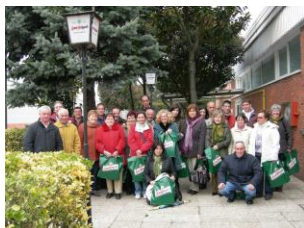
Visita a la fábrica de Cervezas S. Miguel