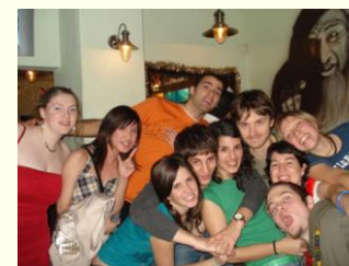
Con sus compañeros erasmus