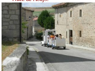
El trenecito por las calles del pueblo