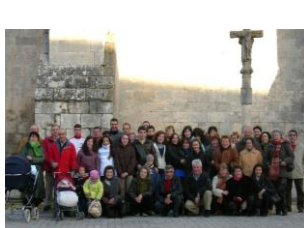
Visita a las Huelgas