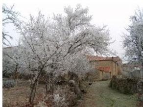
Carama y heladas de Enero