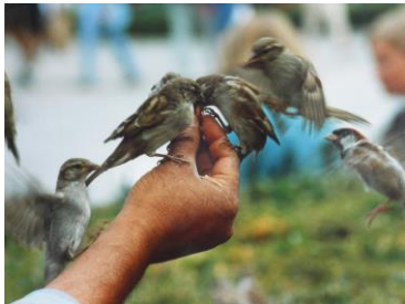
Gorriones, en la Plaza Notre Dame, en París.