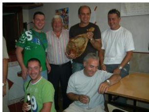
El jamón de la tuta se fue a La Nuez de Abajo.