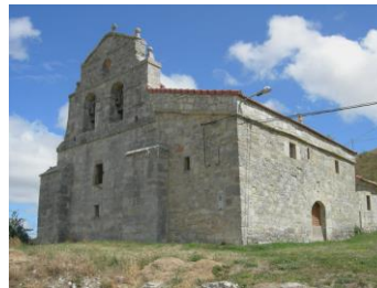
Iglesia de Hormazuela