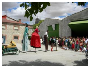
Animación con zancudos