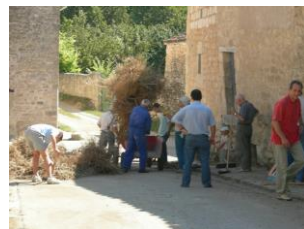
Limpiando las calles (grupo I)