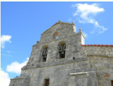
Fachada de la Iglesia