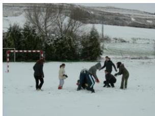
Los jóvenes con la nieve en Sem. Santa