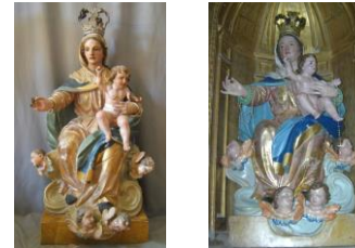
Virgen del Rosario antes y después