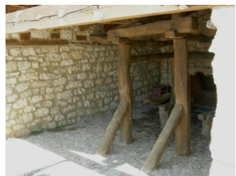
Potro bien conservado